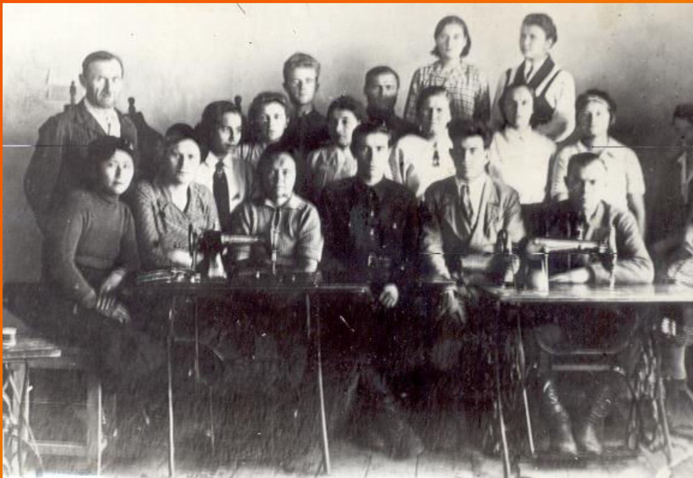
Сотрудники промартели "Коллективный труд" в годы войны.