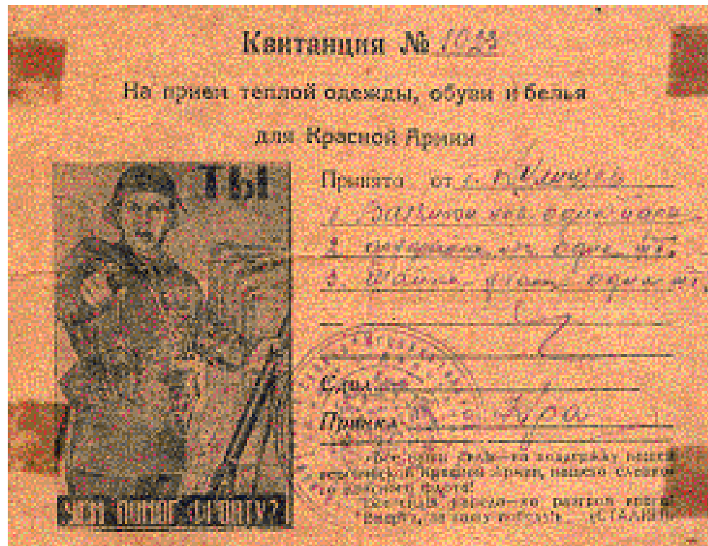
Квитанция на прием теплой одежды, обуви, белья для Красной Армии